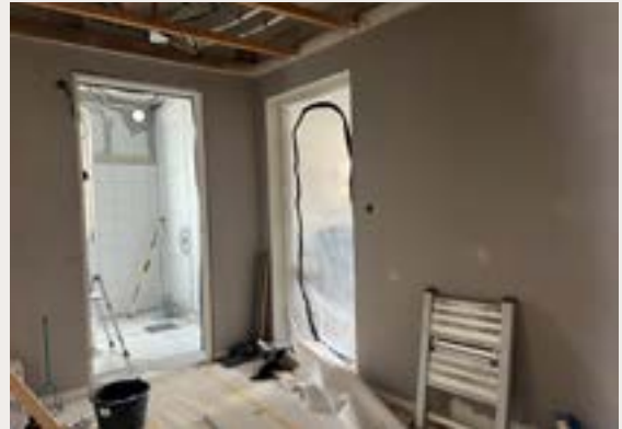
Så här kan det se ut vid en stamrenovering, detta är hall och badrum