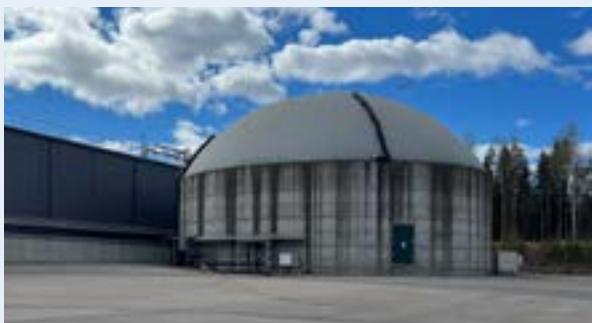
Lagret för biogas och biogödsel på Ekogas

Under besöket bjöds det på smörgåsar bakade på mjöl från en lokal lantbrukare. Flera lantbrukare använder biogödsel från Ekogas till sina odlingar som sedan säljer sitt mjöl vidare till ett lokalt bageri – ett fint exempel på närproducerat och hållbart samarbete.