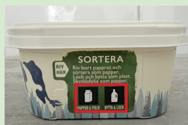
Bilder på förpackningarna var den ska slängas

Du kan även hitta dekalerna på en del förpackningar så du lätt ska veta var de ska slängas. Befintliga dekaler kommer att bytas ut till de nya löpande.