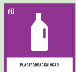
Exempel på ny dekal